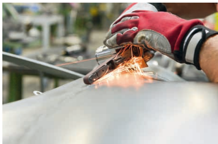
Präzision ist gefragt. Das dünne Blech verzeiht keinen Fehler.