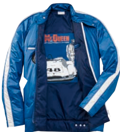
Rennjacke Damen – STEVE MCQUEEN™ Mit Porsche Stickerei auf der Rückseite und Steve McQueen Artwork auf dem Innenfutter. 100 % Polyester. In Blau. WAP 808 OXS-XXL OE | EUR 349,00*