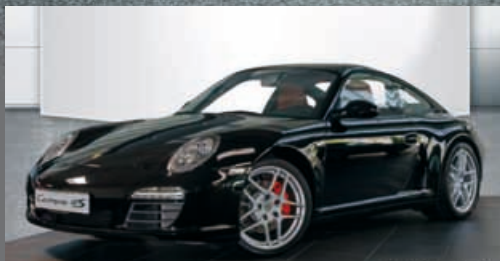
Porsche 911 Carrera 4S | EUR 66.500*

Schwarz EZ: 03/2010 | 61.041 km Monatliche Leasingrate: EUR 647,17 Laufleistung p.a.: 10.000 km Laufzeit: 36 Monate Einmalige Sonderzahlung: EUR 10.000*