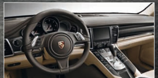
DAS MULTIFUNKTIONSLENKRAD erlaubt die komfortable Bedienung von Audio-, Telefon- und Navigationsfunktionen sowie Bordcomputer.

Mit überragender Sportlichkeit und beeindruckenden 300 PS. Bei extrem niedrigem Verbrauch und hoher Effizienz. Garantiert ohne Kompromisse.