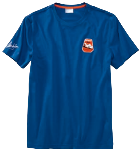
T-Shirt „Face“ Herren – STEVE MCQUEEN™ Steve McQueens Gesicht als Artwork auf der Rückseite. 100 % Baumwolle. In Blau. WAP 816 OOS-3XL OE | EUR 59,00*