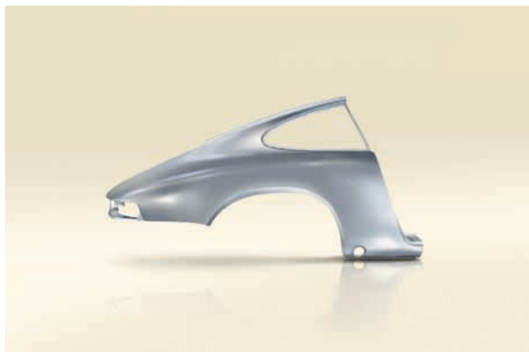
Das Seitenteil des Porsche 911 Carrera RS 2.7 – erstmals als Ersatzteil verfügbar.