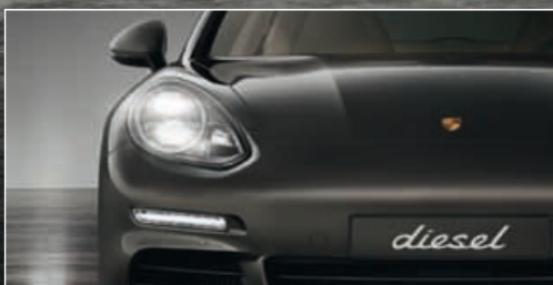
DIE BI-XENON-SCHEINWERFER mit automatischer dynamischer Leuchtweitenregulierung sind im neuen Panamera Diesel Serie.

Was dabei herauskommt, wenn wir einen Sportwagen für die Langstrecke weiterentwickeln? Immer ein Sportwagen.