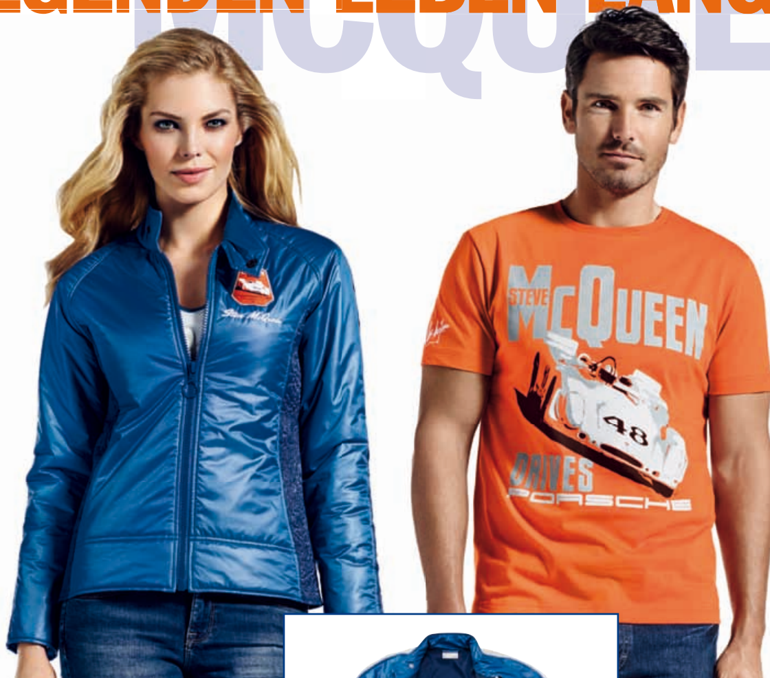
T-Shirt „Car“ Herren – STEVE MCQUEEN™ 100 % Baumwolle. In Orange. WAP 815 OOS-3XL OE | EUR 59,00*