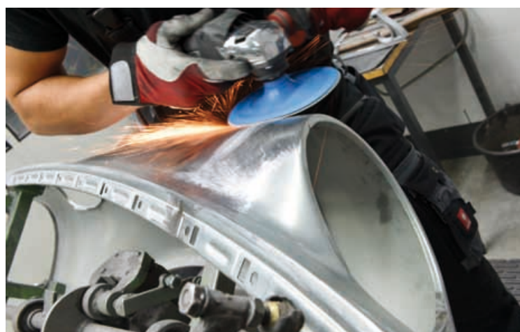
Arbeiten an einer von rund 30 Kotflügel-Varianten.