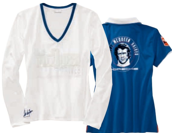
Polo-Shirt Damen – STEVE MCQUEEN™ 95 % Baumwolle, 5 % Elasthan. In Blau. WAP 810 OXS-XXL OE | EUR 79,00*