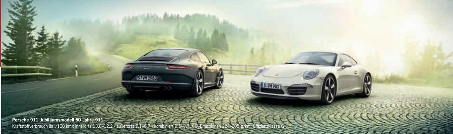
Porsche 911 Jubiläummodell 50 Jahre 911

Kraftstoffverbrauch (in l/100 km): innerorts 13,8–12,2 · außerorts 7,1–6,7 · kombiniert 9,5–8,7; CO-Emissionen 224–205 g/km; Effizienzklasse G