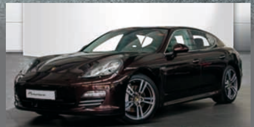
Porsche Panamera 4S | EUR 68.900*

Bei allen Fragen zu unseren Gebrauchtwagen stehen Ihnen unsere Mitarbeiter unter Tel.: +49 (0) 89 / 4 80 01 - 9 11 oder per E-Mail unter info@pzm.de gerne zur Verfügung.