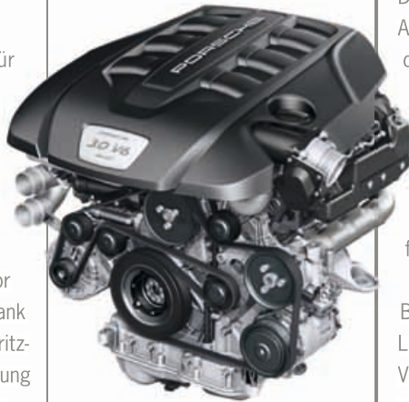
DER V6-MONOTURBO DIESELMOTOR wurde neu entwickelt und verfügt erstmals über einen wassergekühlten Turbolader mit größerem Durchmesser.

Ausgestattet mit einem V6-Monoturbo Dieselmotor bringt er eine Leistung von 300 PS – und bietet dank neu entwickelter Kolben, einem optimierten Einspritz- und Ventilsystem sowie verbesserter Ladeluftkühlung ganze 50 PS mehr als sein Vorgängermodell. Ein weiterer Grund für die enorme Leistungssteigerung: der vergrößerte Turbolader. Im neuen Modell ist er erstmals mit einer Wasserkühlung ausgestattet, die für eine optimale Wärmeabfuhr sorgt. Im Zuge all dieser Optimierungen konnte die Höchstgeschwindigkeit auf 259 km/h gesteigert werden – Porsche Performance in seiner reinsten Form.